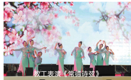
教工表演《常德诗弦》