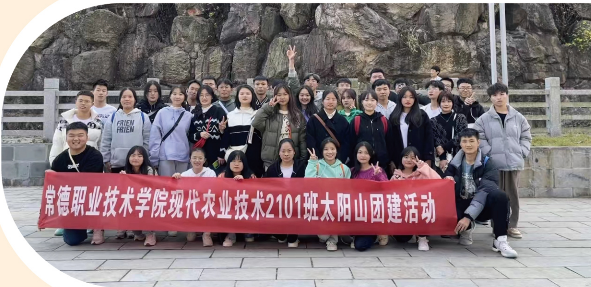
学生参与团建活动