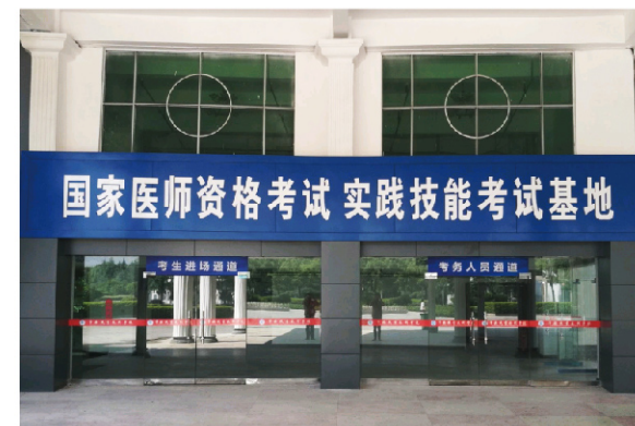
国家医师资格考试考点