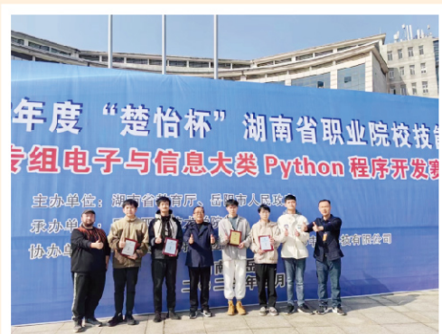
2023年度“楚怡杯”湖南省职业院校技能竞赛Python程序开发赛项获一等奖

【技能证书】 国家软考证书：网络工程师、网络规划设计师、阿里云ACA、阿里云ACP、Oracle Java OCA。