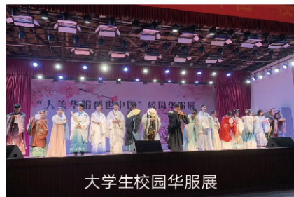
大学生校园华服展