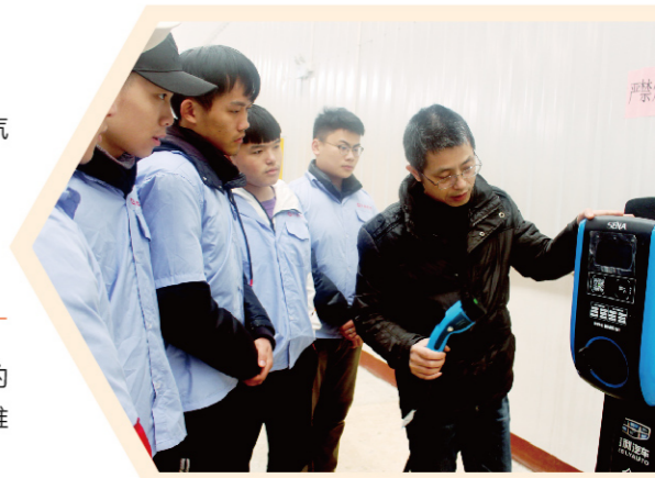
新能源汽车技术专业学生实训