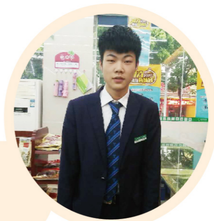
成长迅速的益丰片区主任