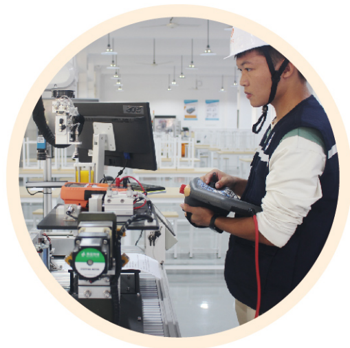
工业机器人专业学生实训