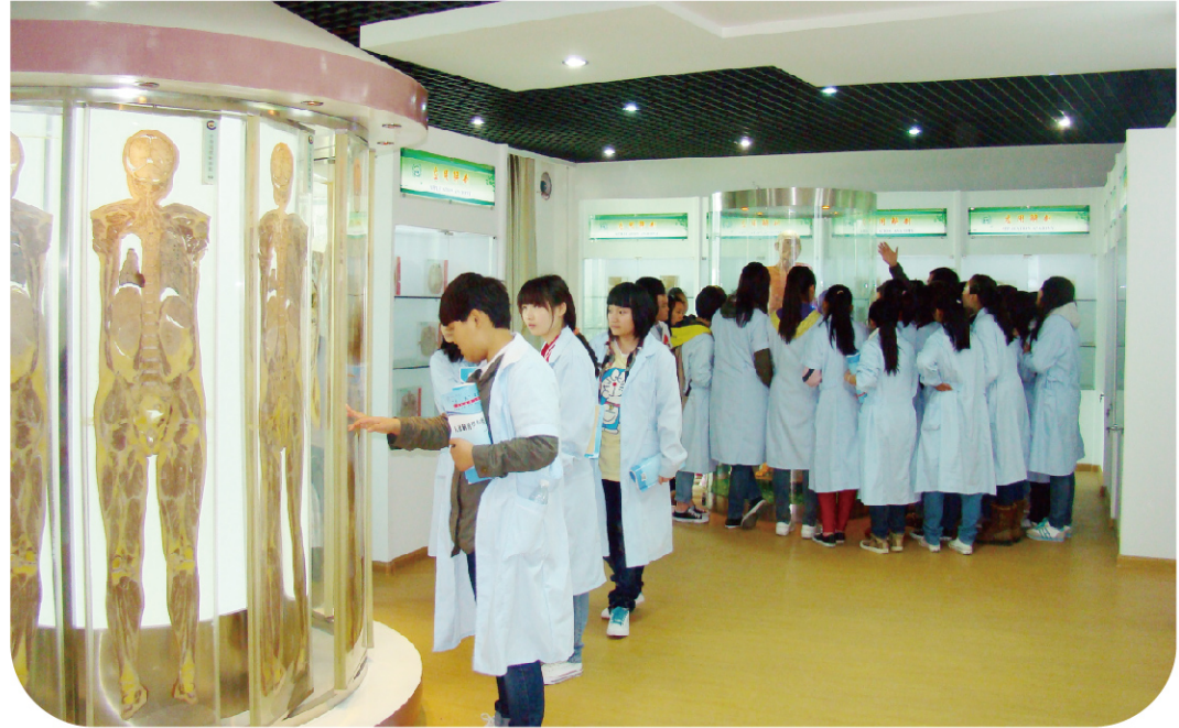
学生在人体生命科学馆参观学习