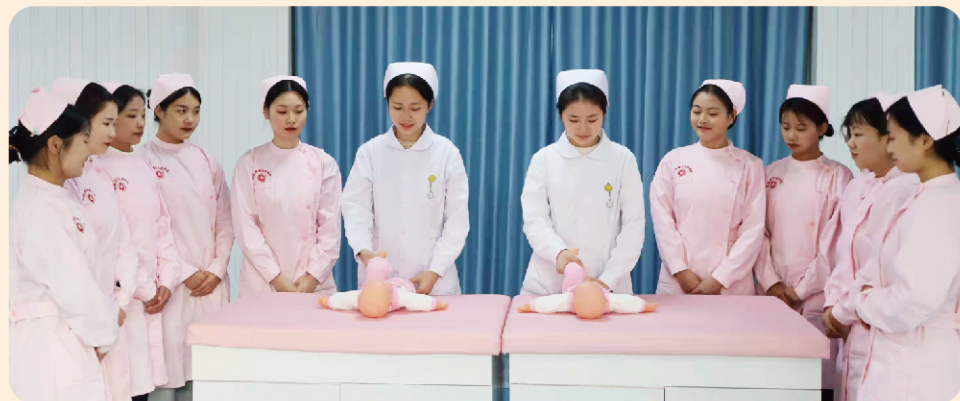
学生进行操作学习

【技能证书】 护士执业资格证、1+X母婴护理职业技能等级证、1+X幼儿照护职业技能等级证、健康管理师证等。