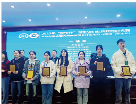
2023年度“楚怡杯”湖南省职业院校技能竞赛业财税融合暨大数据管理会计应用能力赛项获一等奖

【培养目标】 培养思想政治坚定，德技并修、德智体美劳全面发展，适应现代社会的需要，具有一定的科学文化水平，良好的人文素养、职业道德和创新意识，精益求精的工匠精神，较强的就业能力和可持续发展能力；掌握会计专业知识和技术技能，具有会计业务核算、大数据财务分析、纳税申报、财务管理、审计等实际工作能力和创新创业能力，主要面向各类中小企业、金融行业、中介服务机构和非营利组织单位，能胜任出纳、会计核算、办税员、审计助理、财务主管等岗位工作的复合型技术技能人才。