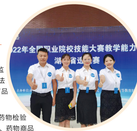
2022年省职业院校教师职业能力比赛一等奖