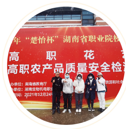
2022年度楚怡杯省职业技能竞赛 高职花艺赛项获一等奖

【技能证书】 家庭农场粮食生产经营职业技能等级证书、粮农食品安全评价职业技能等级证书、设施蔬菜生产职业技能等级证书、植保无人机应用职业技能等级证书。