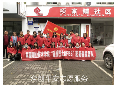
众创平安志愿服务