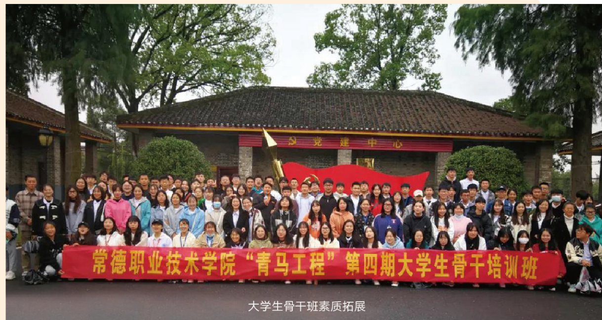
大学生骨干班素质拓展