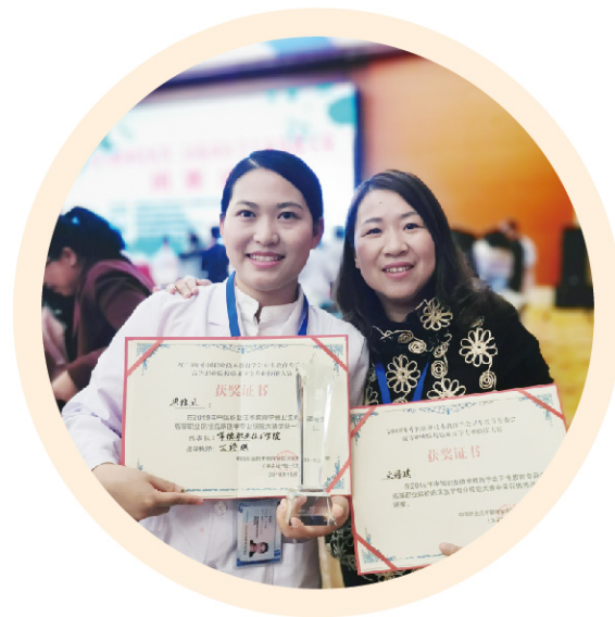
全国第三届高等职业院校 临床医学专业技能大赛一等奖