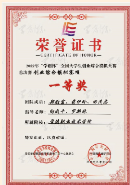
2022年“学创杯”全国大学生创业综合模拟大赛总决赛创业综合模拟赛项一等奖

为有就业意愿并积极求职的城乡居民最低生活保障家庭、孤儿、残疾人、在校期间已获得国家助学贷款的毕业生、原建档立卡贫困生提供一次性求职创业补贴。