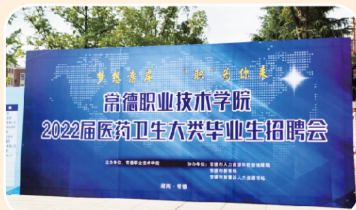
2022届医药卫生大类毕业生招聘会

学院高度重视毕业生就业工作，把此项工作作为学院的一项中心工作长抓不懈。学院是湖南省示范性高职院校、教育部第二批现代学徒制试点高校、湖南省“楚怡”高水平高职学校和专业群建设单位、湖南省“楚怡工匠计划”试点高校。学院立足常德，面向湖南，辐射全国，不断开拓就业市场，对接行业龙头和品牌企业，积极推进校企合作和“订单”培养，毕业生毕业去向落实率一直稳定在90%以上。