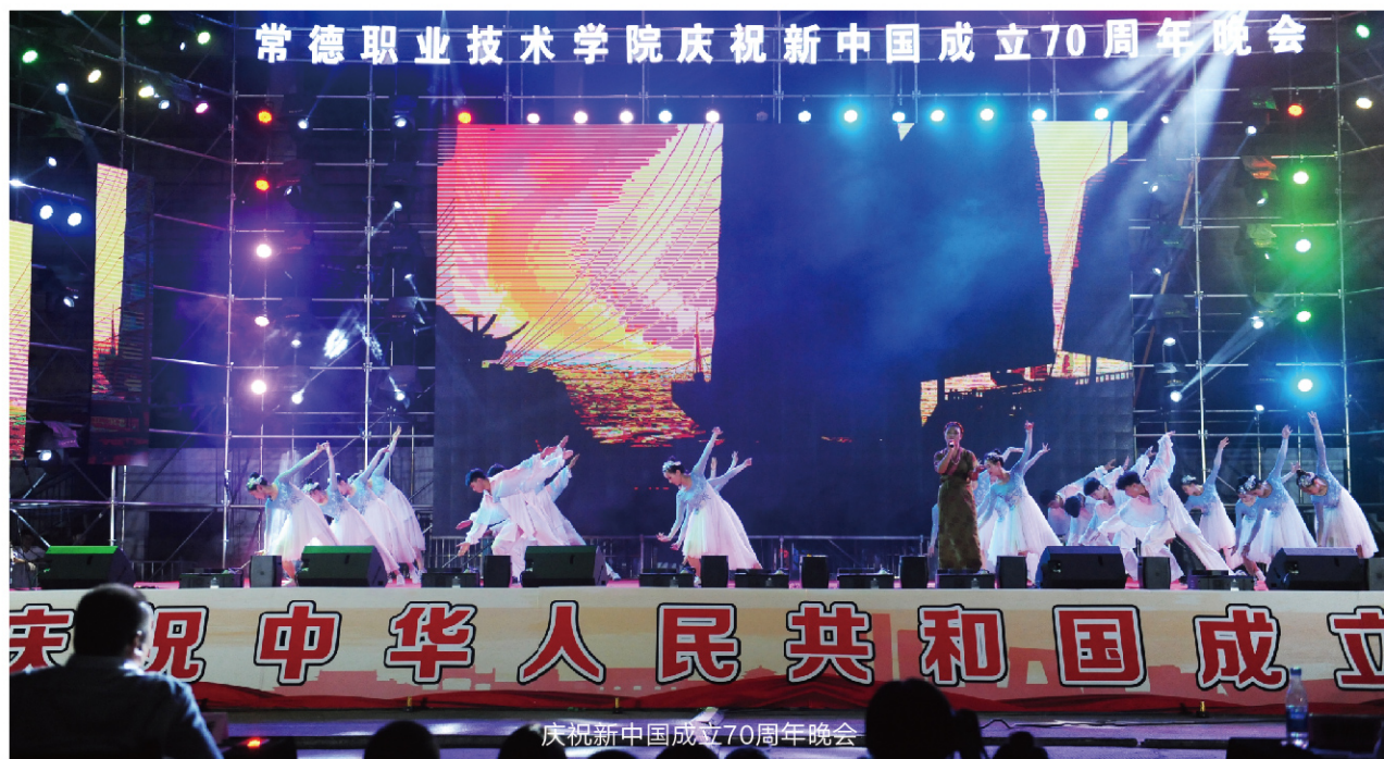
常德职业技术学院庆祝新中国成立70周年晚会