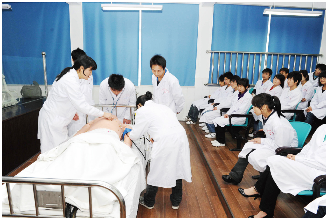
内科ECS仿真模拟人实训