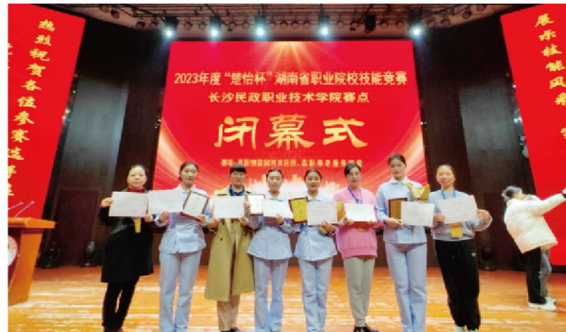
2023年度“楚怡杯”湖南省职业院校职业技能竞赛高职养老服务技能赛项获一等奖