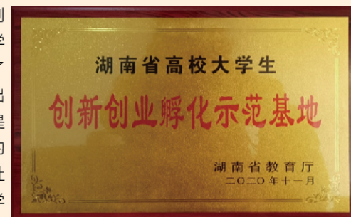
湖南省教育厅授牌我院创新创业孵化示范基地

学院学生会和团委分别设立了助创部和创新创业协会，为有创新创业兴趣的同学提供了舞台。学院对有志于创新创业的学生实行弹性学制，设立了创新创业奖学金，奖励在创新创业活动中表现突出的学生。学院的大学生创业孵化基地为全院学生提供免费的项目孵化场地和指导服务，为在校学生的创新创业项目提供完备的后勤保障。学院引入人社系统的创业系列培训，聘请有丰富创业经验和教学经验的创培导师对有创业兴趣的学生进行系统培训，开阔学生的视野，增强学生的实践能力。