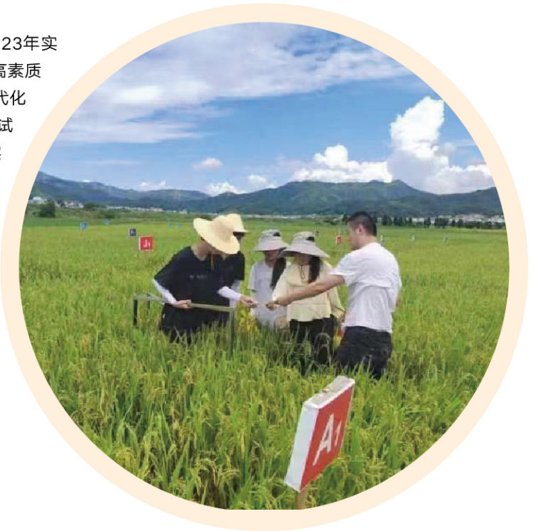
农学专业学生田间实践

楚怡工匠计划： 是湖南省2023年实施的一项旨在培养职业本科层次高素质技术技能人才，为建设中国式现代化新湖南提供技术技能人才支撑的试点工作（《湖南省教育厅关于实施“楚怡工匠计划”试点工作的通知》，湘教发[2023]16号）。“楚怡工匠计划”主要聚焦服务“三高四新”、乡村振兴战略的专业，由省属本科高校和高水平高职院校结合自身办学特色，合理安排招生专业，联合培养具有高尚的职业道德，先进的职业理念，较高的文化水平，熟练的专业技能，创新的思维能力的高素质本科层次技术技能人才。