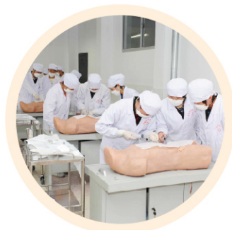
综合穿刺仿真实训