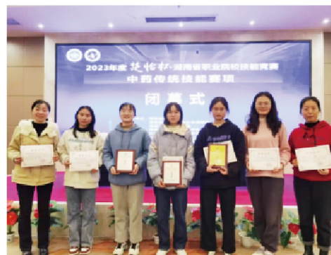
2023年度“楚怡杯”湖南省职业院校技能竞赛中药传统技能赛项一等奖

【职业技能资格证】 执业中药师、药品购销员、中药炮制工、中药制剂工、中药检验工等。