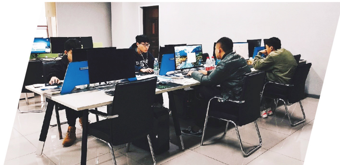
课堂BIM技术教学实训一角