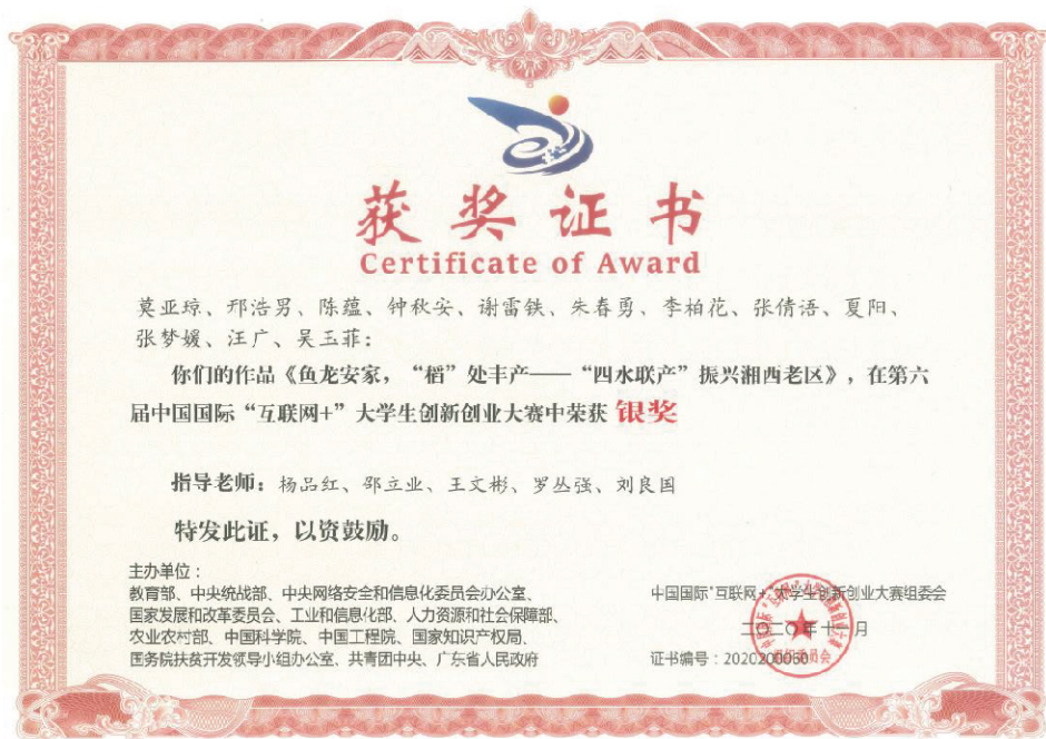
第六届中国国际“互联网+”大学生创新创业大赛银奖

近三年来获湖南省“互联网+”大学生创新创业大赛二等奖1项、三等奖3项，全国大学生生命科学竞赛国家三等奖1项、省级二等奖1项、省级三等奖1项，省级大学生创新创业项目8项。