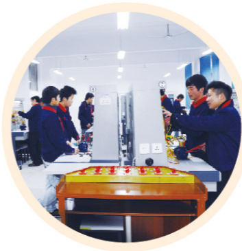
机电一体化专业学生实训