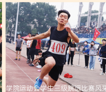
学院运动会学生三级跳远比赛风采