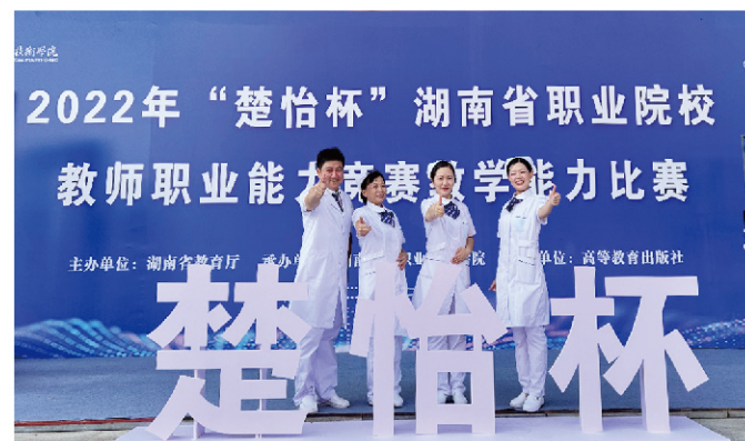
护理系教师团队获2022年湖南省职业院校教师职业能力竞赛教学能力竞赛一等奖

【培养目标】 培养理想信念坚定，德、智、体、美、劳全面发展，具有一定的科学文化水平，良好的人文素养、职业道德和创新意识，精益求精的工匠精神，较强的就业能力和可持续发展的能力，掌握健康监测、健康评估和分析、健康教育与促进等基本知识，具有健康体检套餐设计、健康风险评估、健康教育指导、健康危险因素干预、制定个体及群体的健康干预方案等能力，面向卫生和社会保障行业的健康管理师等职业群，能够从事个人或（和）群体健康咨询与服务、健康产品与服务策划、智慧健康技术服务、健康教育与培训和智慧健康项目管理等工作的复合型技术技能人才。