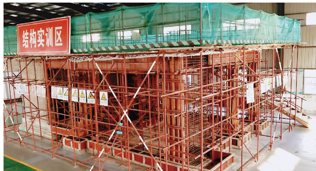
建工实训中心结构实训区主体部分，结合现代BIM信息化手段，按照建筑工地真实施工作业场景1:1打造，满足施工技术课程教学实训要求