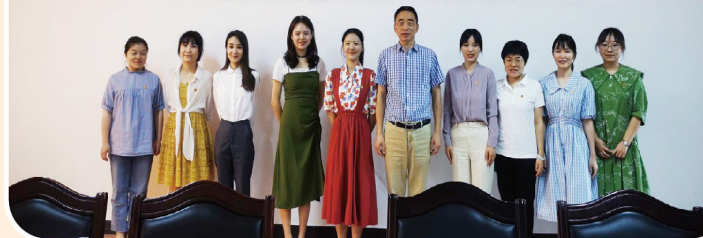
大学生西部计划志愿者合影