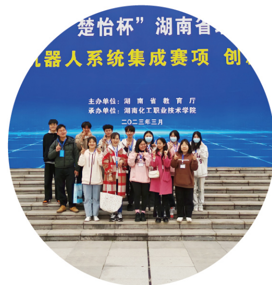
2023年“楚怡杯”湖南省职业院校技能竞赛创新创业赛项二等奖