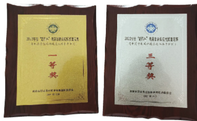
2022年度楚怡杯省技能竞赛鸡新城疫抗体水平测定赛项一等奖和三等奖奖牌

【技能证书】 执业兽医证书、家畜繁殖工证书、家畜饲养工证书、动物疫病防治员证书、宠物医师证书。