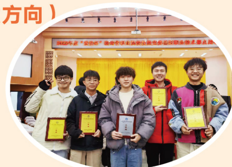
2022年度“楚怡杯”湖南省职业院校技能竞赛软件专业荣获四个一等奖、一个二等奖