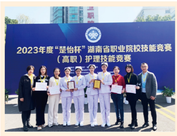
2023年度“楚怡杯”湖南省职业院校职业技能竞赛高职护理技能赛项获一等奖

【技能证书】 护士执业资格证、1+X老年照护职业技能等级证、1+X母婴护理职业技能等级证、1+X幼儿照护职业技能等级证、健康管理师证等。